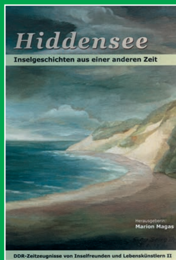
HIDDENSEE – INSEL- GESCHICHTEN AUS EINER ANDEREN ZEIT (2008)